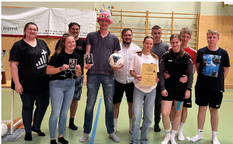
Katholische Jugend Gnas Championsliga, Foto: privat