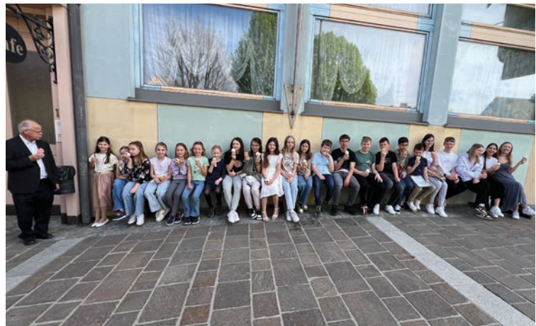
Eisessen Minis Gnas