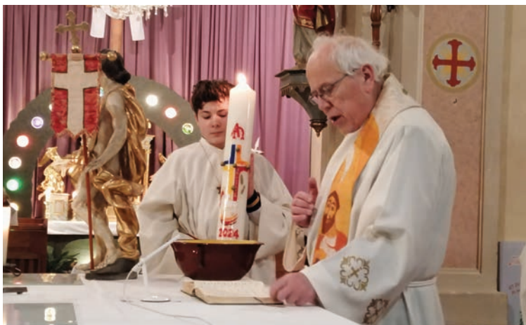
Osternacht Jagerberg