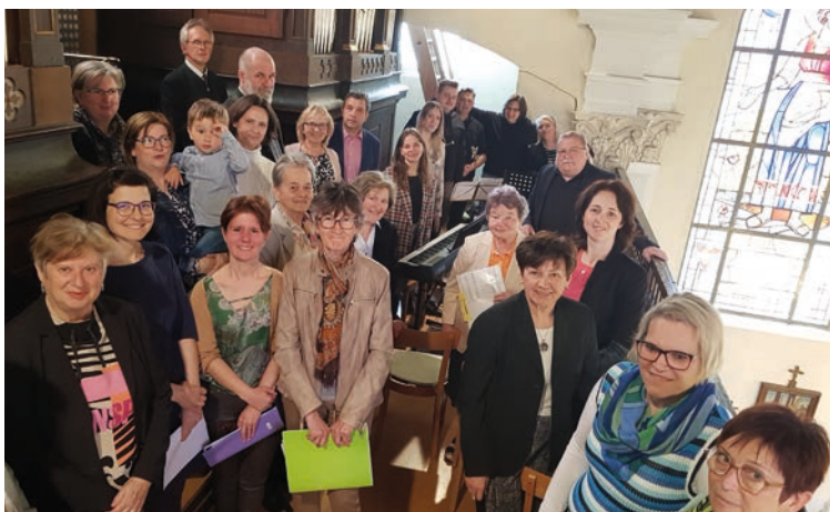
Familienchor Ostersonntag, Pfarre Bad Gleichenberg