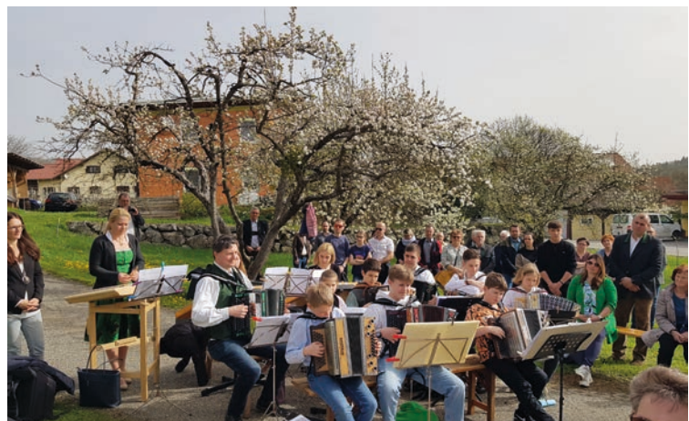
Emmausgang, Pfarre Bad Gleichenberg, Foto: Silvia Schuster