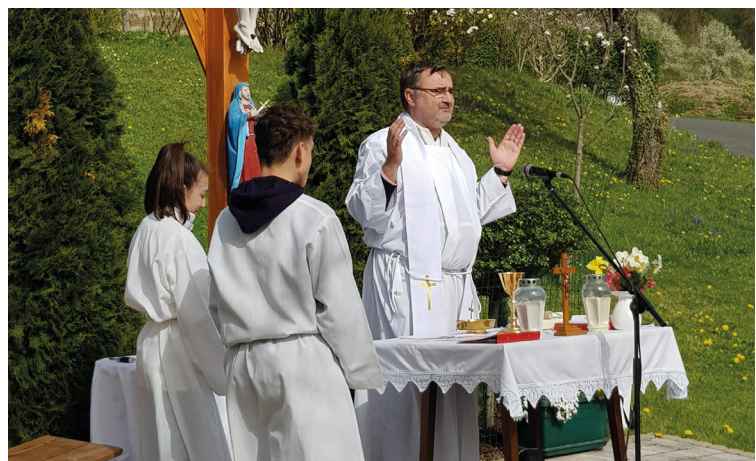
Emmausgang Hödl Kreuz, Pfarre Bad GleichenbergG, Foto: Silvia Schuster