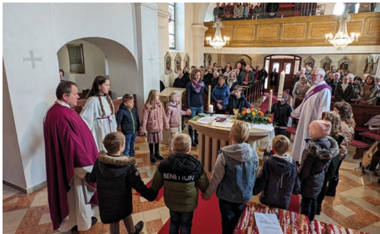
Vorstellungsgottesdienst Erstkommunion, Mettersdorf