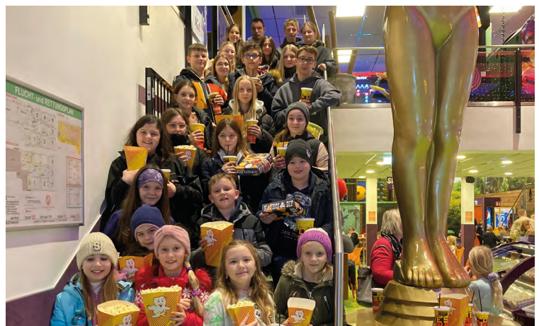
Ministrantenausflug Gnas Kino Gleisdorf, Foto: Christine Kickmaier