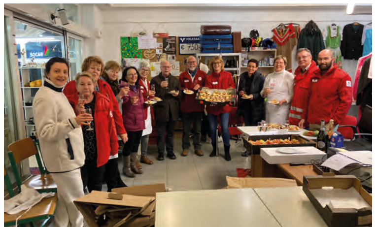
Tafel Bad Gleichenberg