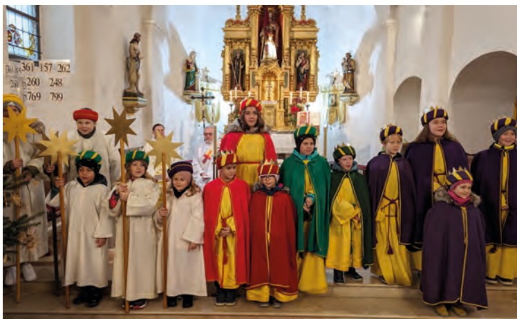
Sternsinger Mettersdorf, Foto: Prisching M.