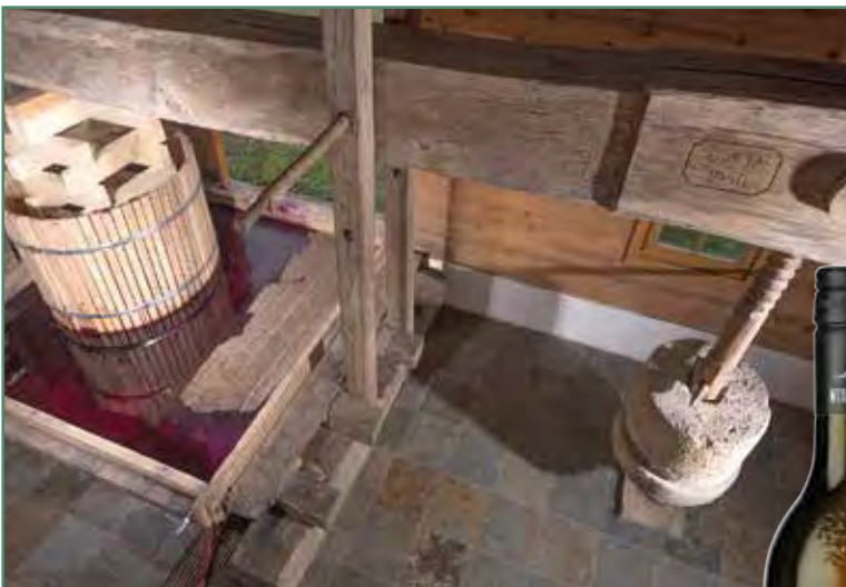
Traditionelle Herstellung mit der Baumpresse

BAUER am Hauptplatz Kaiser-Franz-Josef-Str. 2 8344 Bad Gleichenberg Tel.: 03159 / 2281 Öffnungszeiten: Mo. - Fr. 8.00 - 12.00 und 14.30 - 18.30 | Sa. 7.30 - 12.30