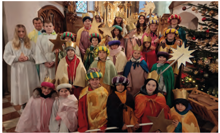
Sternsinger St. Peter