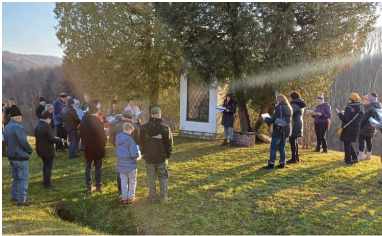
Pfarre Jagerberg, Johanneswegwinterwanderung