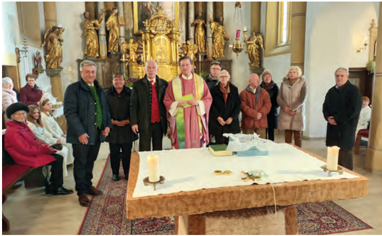
60. Geburtstag Grabner, Pfarre Kirchbach